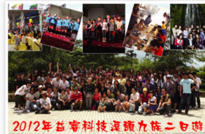
2012年益睿科技溪頭九族二日遊