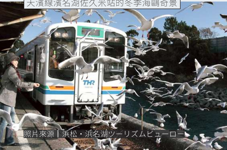
天濱線濱名湖佐久米站的冬季海鷗奇景