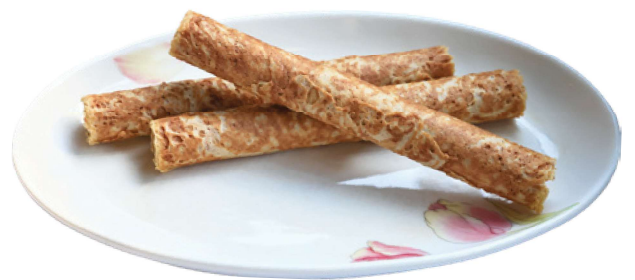
集集必買伴手禮 山蕉蛋捲

新，全面提升基礎設施。終於在2026年1月列車復駛至集集站，並規劃於7月全線通車！期能重新帶動沿線的觀光與活力。當您拜訪集集線，這裡不僅是一條旅遊的路線，更是一段災後重生、再次啟程的鐵道史。