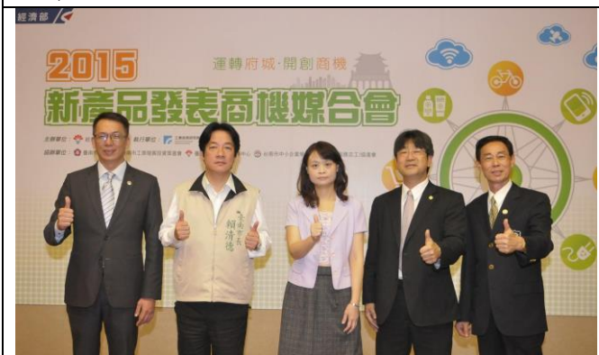
圖五：貴賓合影，左起工研院資通所經理張滋煒、臺南市長賴清德、經濟部中小企業處副處長蘇文玲、臺南市工商發展投資策進會代理總幹事王建民、台南市中小企業榮譽指導員協進會會長林泰檳。