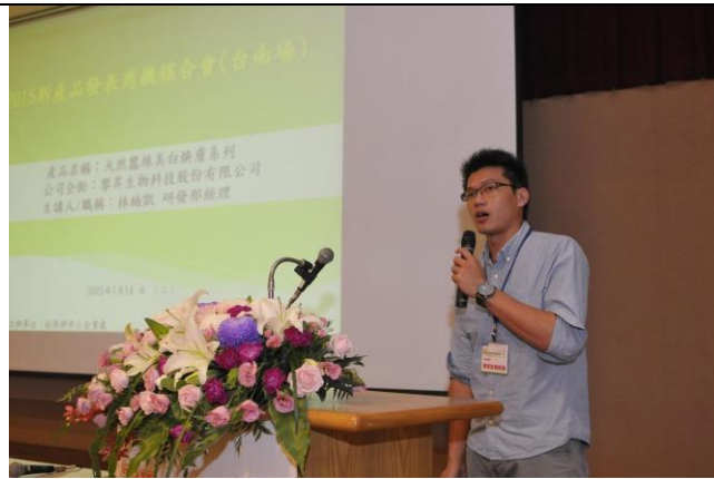
圖八：參展企業簡報發表。