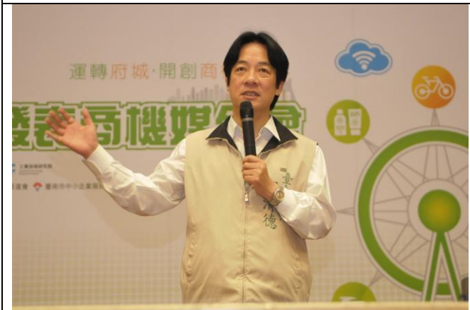
圖三：臺南市長賴清德蒞臨活動會場勉勵發表企業。