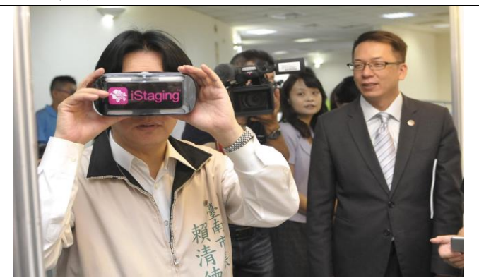
圖六：臺南市長賴清德體驗宅妝公司所研發的虛擬實境數位賞屋新科技。