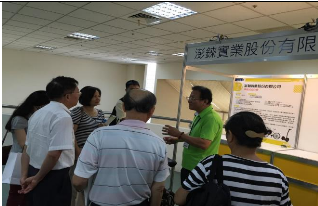
圖十：參展企業向與會來賓解說產品功能。