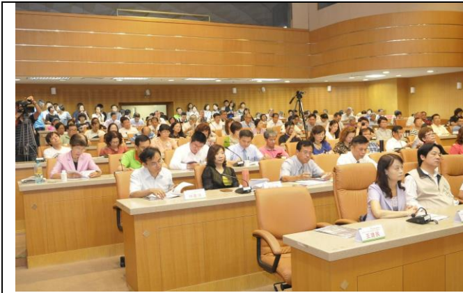
圖一：來賓踴躍參加「2015 新產品發表商機媒合會」(台南場)活動。